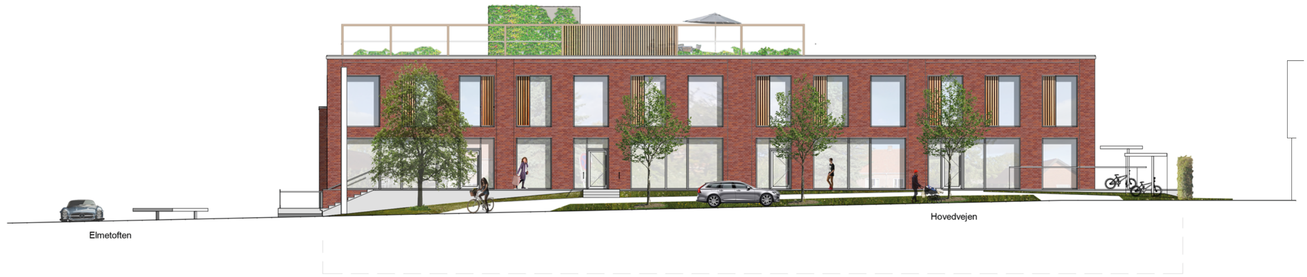
Facade mod nord