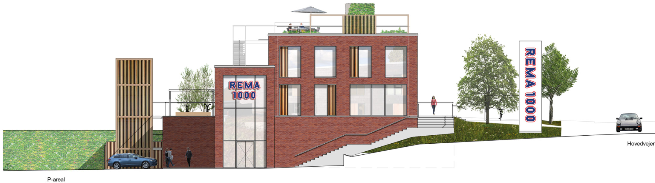
Facade mod øst